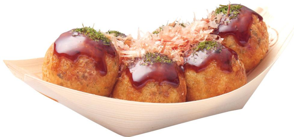
※築地銀だこ “ぜったいうまい!! たこ焼” (ソース、6個入り)

このたび“築地銀だこ”が、満を持して日本から世界へ向けてメジャーデビュー！今期、日本人選手の活躍が期待され、全世界から注目を浴び盛り上がっている ロサンゼルス・ドジャースのホーム球場『ドジャー・スタジアム』 に、日本を代表する “和のファストフード” として“ぜったいうまい!! たこ焼”を米国のベースボールファンへご提供いたします！また、 ドジャー・スタジアムでしか味わえない『ドジャー・スタジアム限定たこ焼』 も発売予定！ぜひご期待ください！