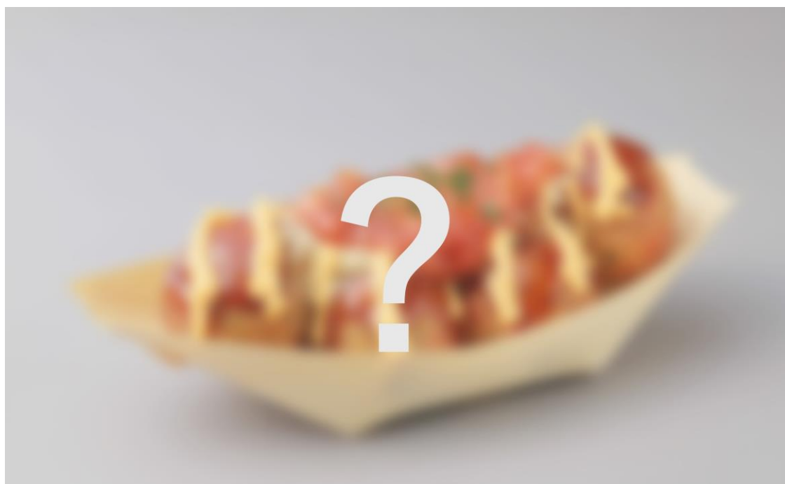
※『ドジャー・スタジアム限定たこ焼』も、発売予定！