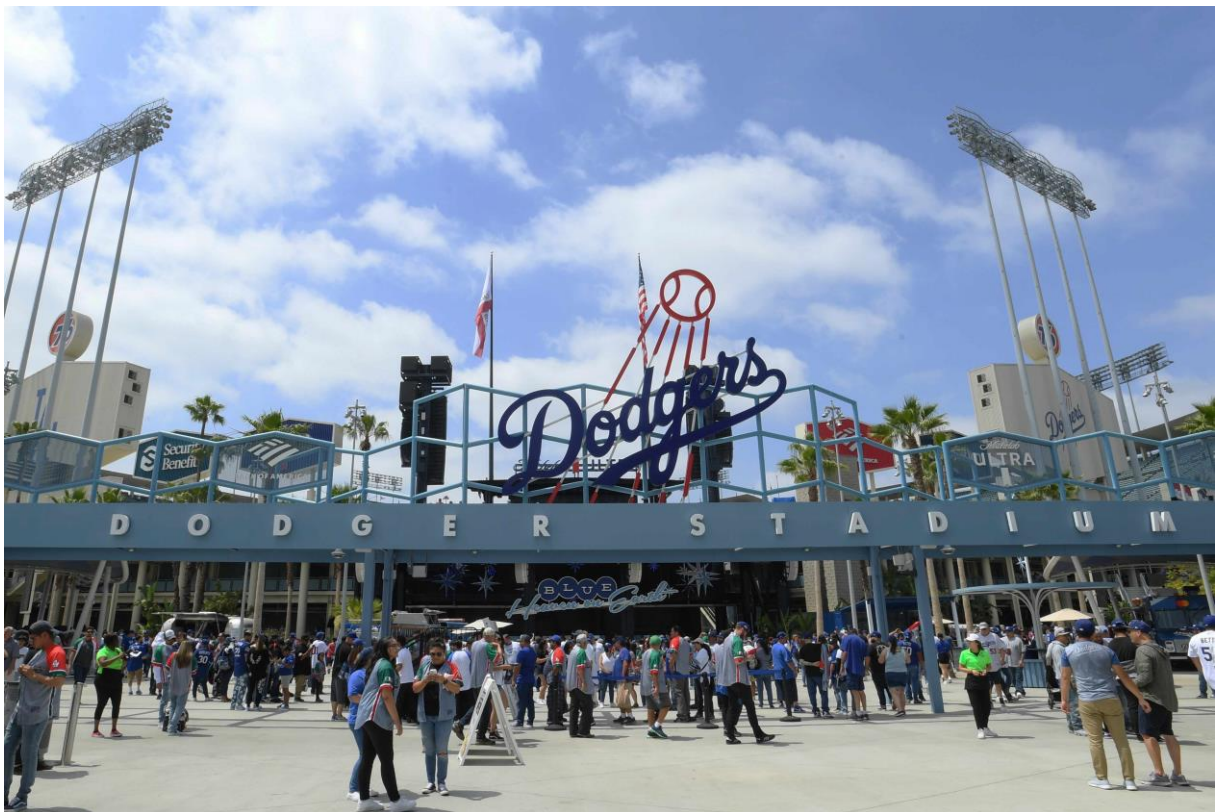
※ロサンゼルス・ドジャースのホーム球場：ドジャー・スタジアム

日本国内では全国の野球場（ドーム球場含む）の“人気定番球場メシ”として定着している“築地銀だこのたこ焼”。野球場への出店は、2008年に現：楽天モバイルパーク宮城への催事出店を皮切りに、「明治神宮球場」、「東京ドーム」、「ZOZOマリンスタジアム」、「ベルーナドーム」、「阪神甲子園球場」、「京セラドーム大阪」、「福岡PayPayドーム」、「エスコンフィールド北海道」（順不同）などへ次々に出店。一口大で食べやすく、“ビールやハイボールなどの飲み物との相性も最高！”と、野球観戦と共に、創業以来人気No.1の“ぜったいうまい!! たこ焼”や各球場の限定たこ焼等を、野球ファンをはじめ多くの方々にお楽しみいただいております。