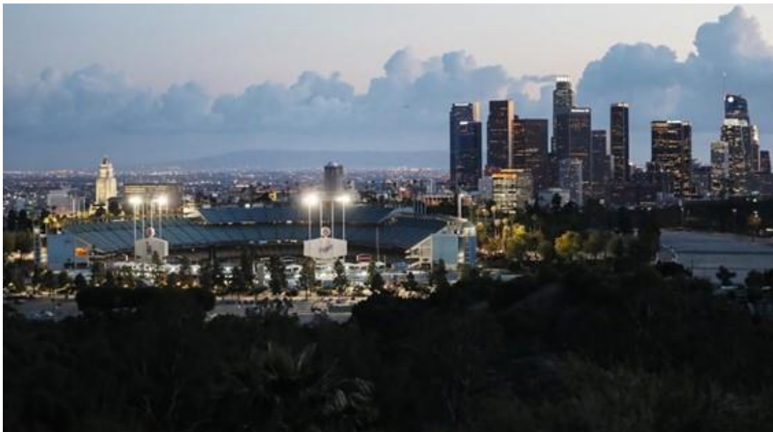
※ロサンゼルス・ドジャースのホーム球場：ドジャー・スタジアム